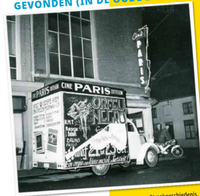
1960, Hospitaalstraat