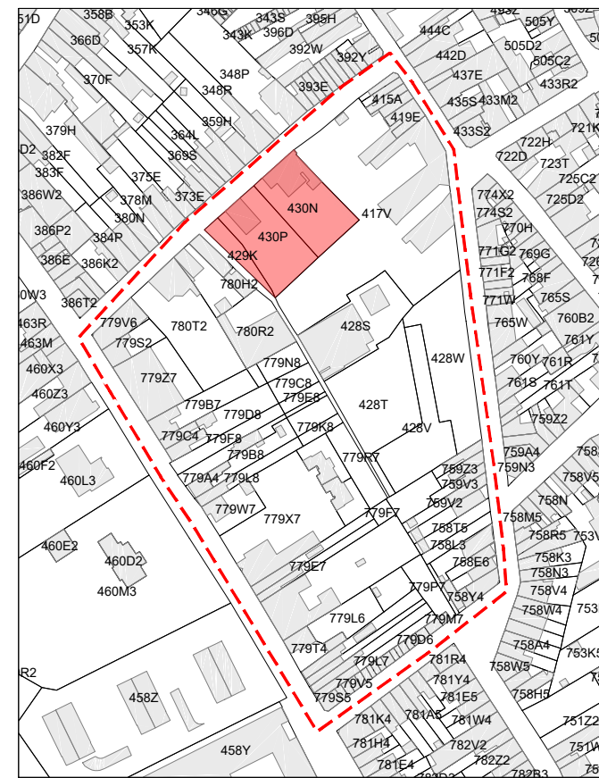
INZETKAART: Op te heffen verkavelingen

In zijn ontwerpversie gezien en voorlopig vastgesteld door de gemeenteraad in zitting van 26/10/2020. Op bevel,